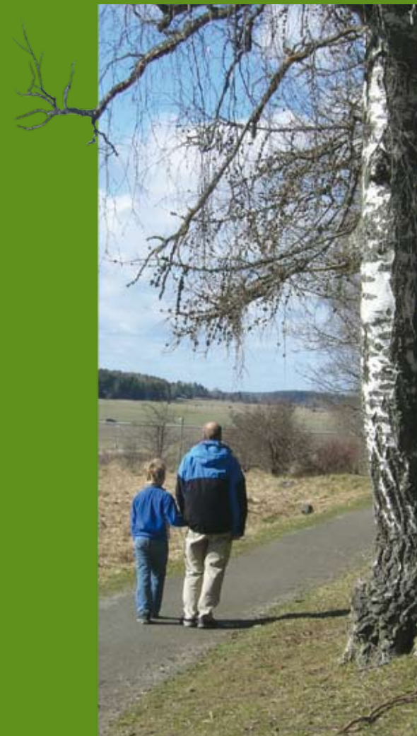
Produktion: Fritids- och naturkontoret i samarbete med Informationsservice, Uppsala kommun 2008. 276815